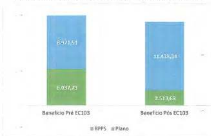
Gráfico 2: Impacto da EC103 no valor da pensão por morte

27. Nesse sentido, considerando o mesmo exemplo utilizado para ilustração do benefício de Aposentadoria por Invalidez, o Gráfico 2 demonstra a variação do benefício de pensão por morte da União e da Funpresp-Exe, considerando dois dependentes elegíveis ao benefício no RPPS, resultando em um percentual de 70% aplicado sobre o valor calculado do benefício, sendo 50% da relativos à cota familiar e 20% às cotas individuais.